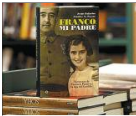
El llibre de la filla de Franco.

Per Nadal les llibreries dels grans magatzems eren plenes a vessar d'exemplars de les memòries de Carmen Franco, titulades Franco, mi padre . Sens dubte, es tracta d'un document de primer ordre, unes memòries emotives contades des de l'afany de descobrir-nos el Generalíssim. Perquè "quan era persona" (així ho diu la filla de Franco), és a dir, abans de ser elegit per l'Altíssim per a abanderar la Santa Croada contra la púrrica roja, Franco era un gran amant de la poesia i del teatre, un home d'humor fi, alegre i col·lega de tots. Aquest llibre ens revela coses d'aquest abast, i qualsevol pot fullejar-lo una mica —en un d'aquests grans magatzems, per exemple El Corte Inglés, on se n'apilen a dotzenes—, i així assabentar-se que Millán Astray era molt simpàtic, una mica impetuós, però l'alegria personificada, tot i que a Carmencita li feia una miqueta de por, perquè li faltava un braç i un ull. Crec que és important que s'editen llibres d'aquesta mena i que estiguen a l'abast de tots, si pot ser a l'entrada dels grans magatzems i en tirades importants: a una editorial com La Esfera de los Libros imprimir records com aquests, sens dubte, l'honora i la legitima per a assolir reptes més importants. M'imagino que el mateix es podria escriure d'Adolf Hitler (que era un artista destacat, amb obres molt cotitzades avui en dia), i assenyalar que Goebbels era un gran amant de la poesia i que amb els acudits de Him-