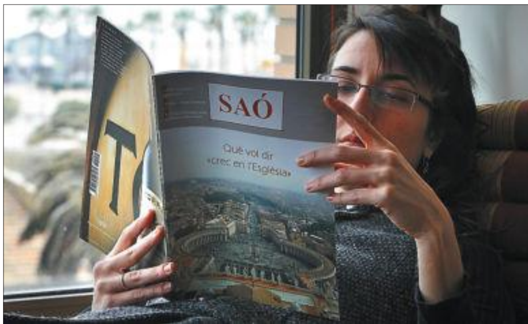
Una dona llegeix l'últim número de la revista Saó .

L'editorial també ens diu que, a pesar de les dificultats econòmiques que la revista passa, la resposta dels subscriptors ha encoratjat els treballadors de Saó a perseverar en la tasca, perquè, com els ha recordat molta