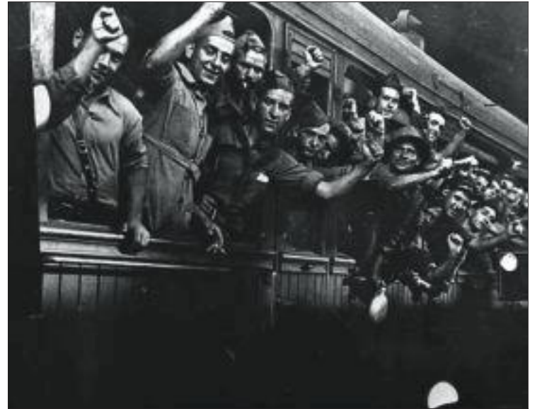
Soldats catalans parteixen cap al front d'Aragó l'any 1936.

La pròpia història dels documents justificaria d'entrada un primer interès per aquest llibre, però la veritat és que el contingut d'aquest primer volum (juliol 1936-gener 1937) ens permet copsar, en primera persona, els esforços fets pels dirigents d'Esquerra Republicana per reforçar