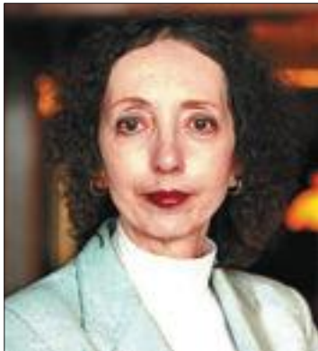
Joyce Carol Oates.

Interessant primera novel·la d'aquest jove físic i escriptor italià que s'ha convertit en tot un fenomen literari. De la mateixa manera que els nombres primers, aïllats en la infinita cadena de la numeració, els dos protagonistes d'aquesta especial història, marcats per una infància traumàtica, s'atreuen malgrat que els anys els aboquen a una llunyania cada cop més intensa.