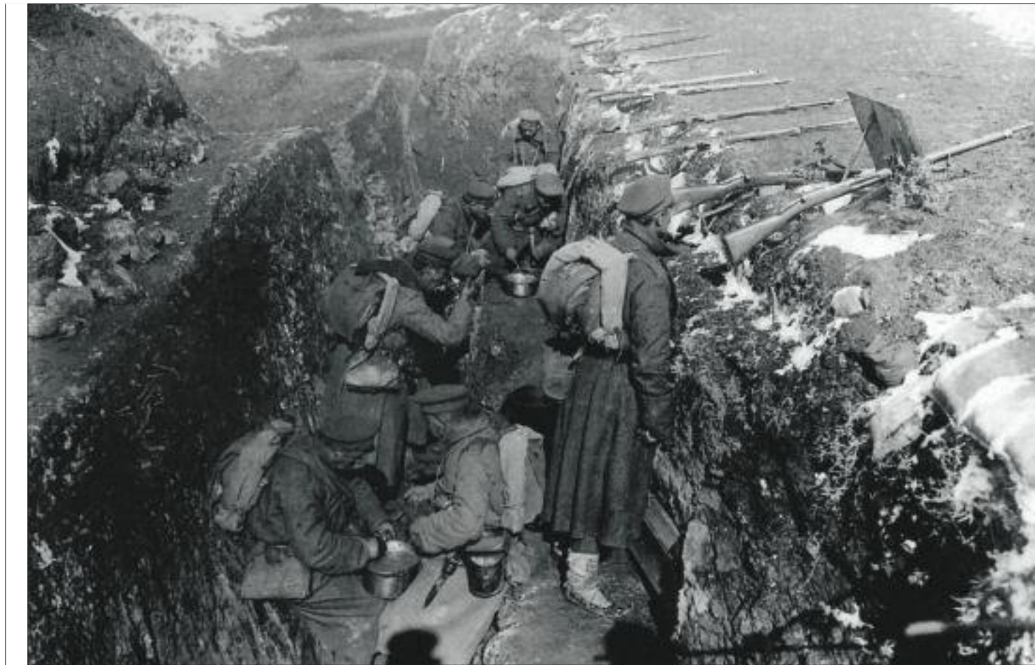
Soldats búlgars dins d'una trinxera al front de Doiran, al setembre de 1918.

Una primera novel·la brillant i original. El veritable protagonista és un centre comercial, Green Oaks, construït als anys vuitanta. Té vida pròpia i sembla perillós. Al seu voltant es mouen una sèrie de personatges, com Kate, una nena que juga a detectius i que desapareix en el centre. Transcorreguts 20 anys encara no se sap què li va succeir.