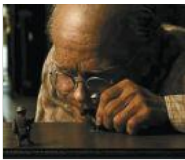
Benjamin Button, del paper al cine.

Però mai deceben. Per què? Doncs perquè sempre hi ha "alguna cosa extra meua", confessava. I perquè, a més de biografia,