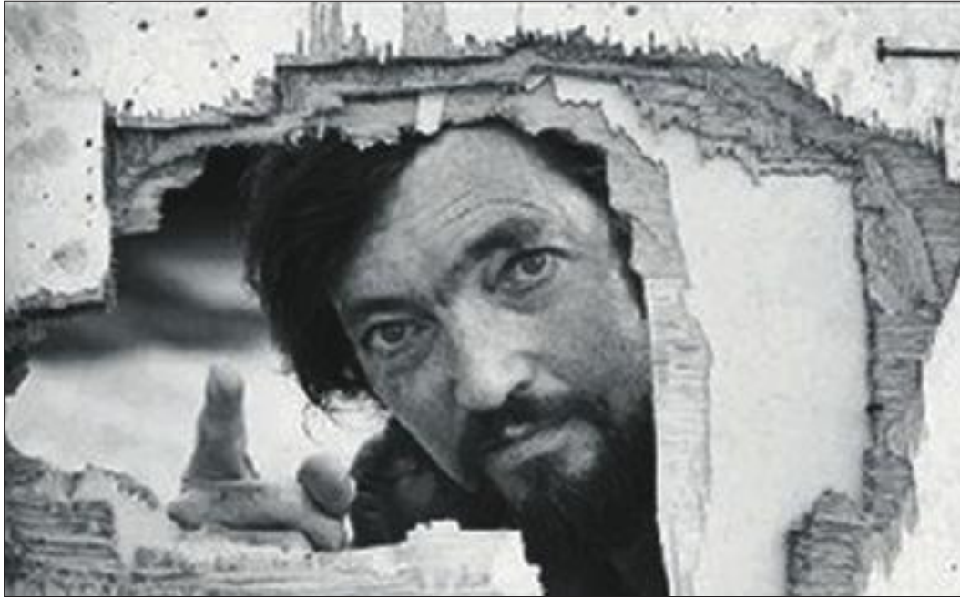
Poder llegir la correspondència d'escriptors com Julio Cortázar és com veure la seva vida per un forat.