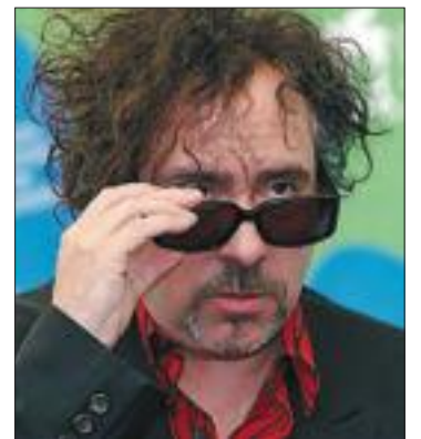
Burton per Burton

Jordi Pujol va definir Trias Fargas (1922-1989) com "honor i flagell" de Convergència. Les raons d'aquest desencontre es troben en la magnífica biografia (premi Gaziell) del polític liberal catalanista, que va voler arribar a dalt de tot i va veure, i criticar sense embuts, com les seves ambicions quedaven estroncades pels polítics del seu bàndol, com Pujol i Roca.