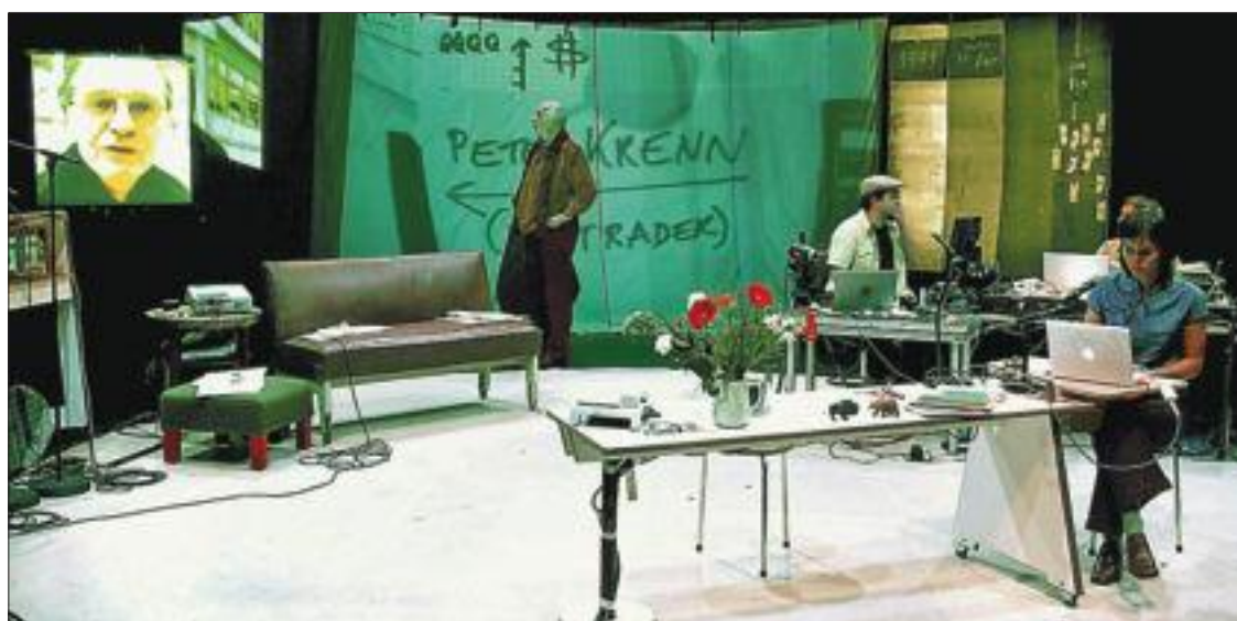
Un momento del espectáculo Dead Cat Bounce .

chael Nyman y Bob Wilson. Y otro dato más: el título, que significa algo así como “el rebote del gato muerto”, es en realidad un término financiero: incluso un gato muerto es capaz de rebotar en el suelo si cae desde cierta altura, pero que rebote —y en el mundo bursátil el rebote se expresa con esas curvas ascendentes de los gráficos— no significa que esté vivo. Es decir, que los índices suban de repente no implica que vayan al alza. Tenganlo en cuenta.