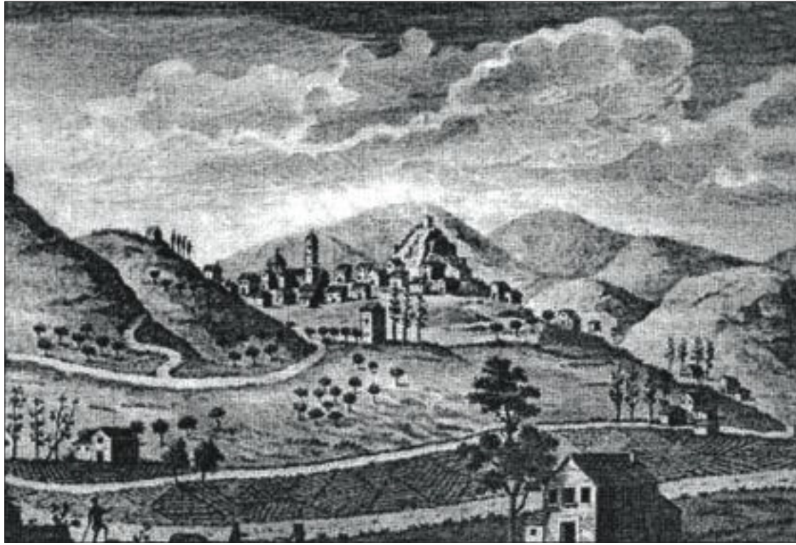
Gravat sobre la zona de Banyeres en les Observacions de Cavanilles.

Aquest Corpus es presenta en dos formats: un d'extens i un altre de reduït. Pel que fa al format extens, consta de dos volums. En el primer, amb una extensió de 1.556 pàgines, es presenta el recull dels termes que formen part dels diferents topònims analitzats, amb l'expressió d'aquests darrers i del municipi on estan situats, i dividits en dos grans blocs: els de les zones de predomini lingüístic valencianoparlant i castellanoparlant, respectivament. Així, si hom cerca el mot font , trobarà, al seu costat, tots els topònims que el contenen i en quin municipi es localitzen; i més encara, si volem conèixer els noms de lloc que contenen el sintagma font freda , ho trobarem en la informació corresponent a l'entrada freda . El segon volum (590 pàgines) és també molt útil, atès que presenta tots els topònims ordenats per municipis, i classificats en diferents ca-