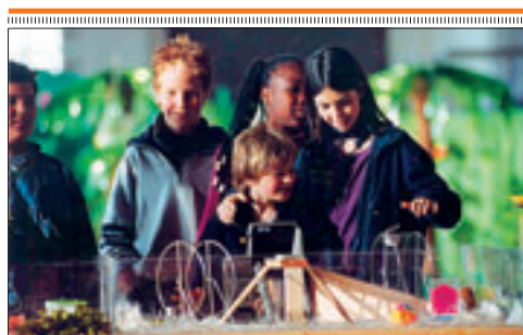
►► Imatge del telefilm (a dalt) i portada del llibre (a sota).