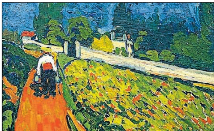
▶▶ Pinzellades gruixudes de verd i vermell a A l'hort del meu pare (1905).

i va guanyar carreres ciclistes i regates, i amb els premis en metàl·lic mantenia la família. Quan una febre tifoidea va malmetre la seva fortaleza física, es va dedicar a tocar el violí en cabarets parisencs. Fins que el galerista Vollard li va comprar tots els quadros i el va treure de la misèria.