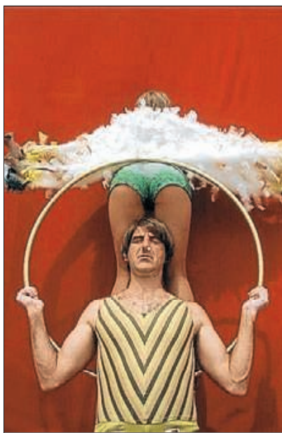
▶▶ Una imatge de Los Galindos.

Nascut fa cinc anys en memòria del desaparegut Joan Armengol i Moliner, poeta i pedagog molt estimat dins el món del circ català, L' 1, 2, 3 del Pallasso s'està consolidant a través d'una variada oferta distribuïda en diferents punts de la localitat