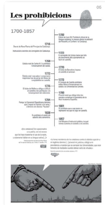
Diptic de l'exposició «1714: El català ahir, avui i demà. Et prenc la paraula» ideada per divulgar la repressió lingüística esdevinguda a partir del Decret de Nova Planta.