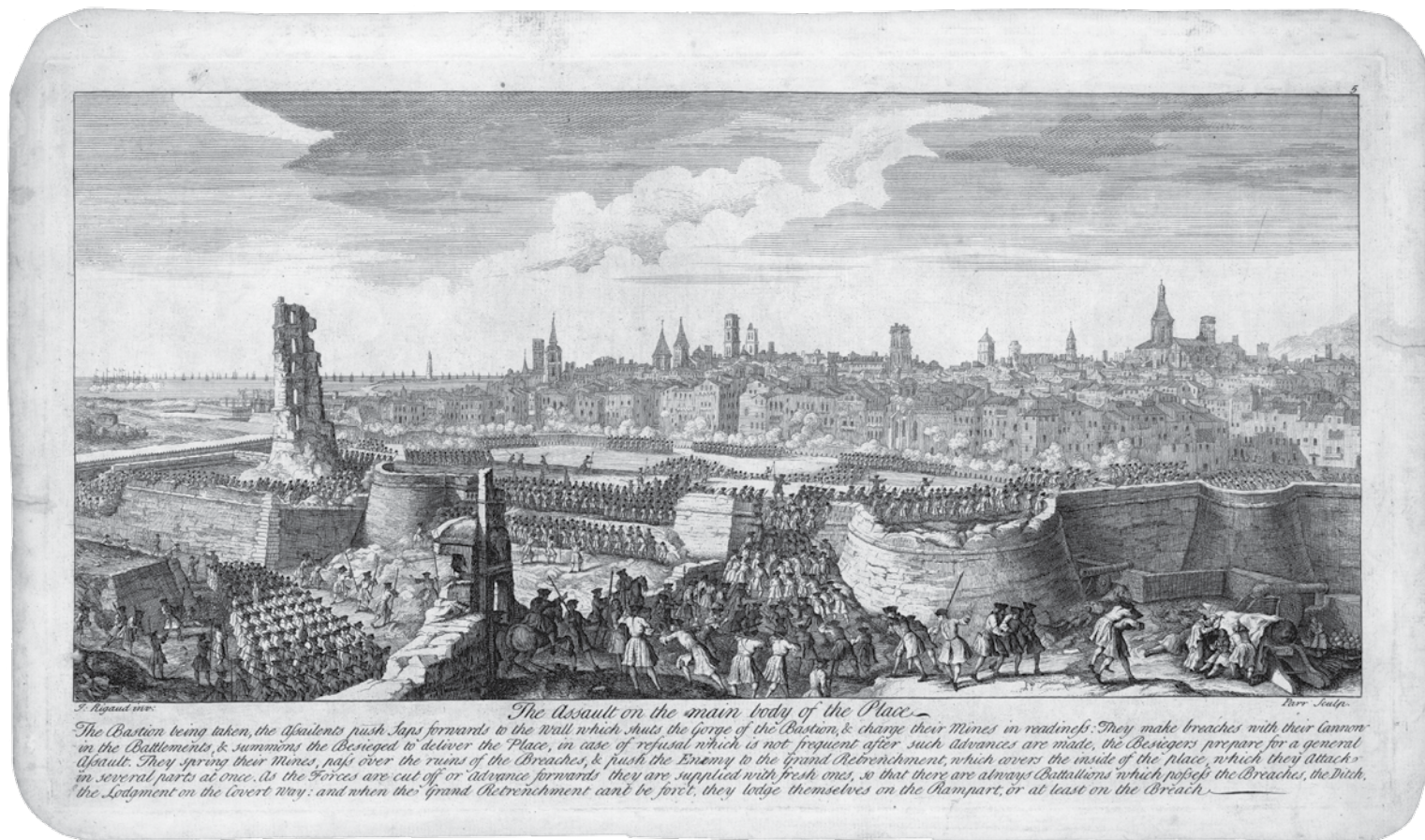
Gravat del setge de Barcelona, de J. Rigard (1750). Font: Institut Cartogràfic de Catalunya.

les Instrucciones secretas a los corregidores . L'exposició presenta sintèticament la cronologia d'una sèrie sistemàtica i continuada de prohibicions a l'ús oficial i públic del català: des del tancament de les universitats catalanes (1714) i les Instruccions secretes als corregidors (1716), fins a l'ús exclusiu del castellà als llibres de comptabilitat (1772), passant per prohibicions a l'ús del català al teatre (1801 i 1867), a l'ensenyament (1768, 1780, 1857, 1900...), en l'edició de llibres (1773), als epitafis dels cementiris (1838), en les escriptures públiques notariales (1862), en el registre civil (1870) [...] fins arribar a la Llei orgànica