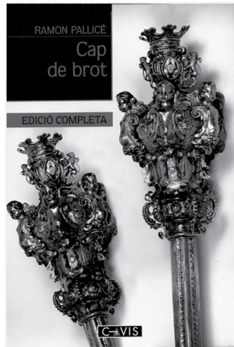
«Té tota la raó, el general Nebot. Els catalans ens hem passat mitja vida buscant reis. Deixem-los, doncs, i proclamem una república», es llegeix a Cap de brot (1982), de Ramon Pallisé.

La literatura sol fer-se eco de qualsevol sentiment personal i, àdhuc, realitat social, històrica, política o militar. L'escenari de la guerra de Successió i les seves conseqüències en el decurs del temps no són cap excepció i els poetes, sobretot, s'hi han referit de manera constant. El cançoner popular n'és ple de referències, però igualment la literatura culta.