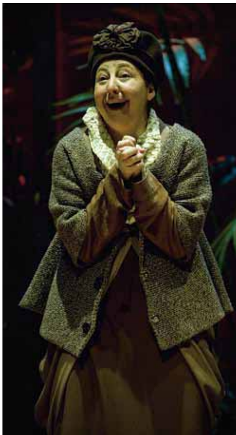
La tortuga de Darwin.