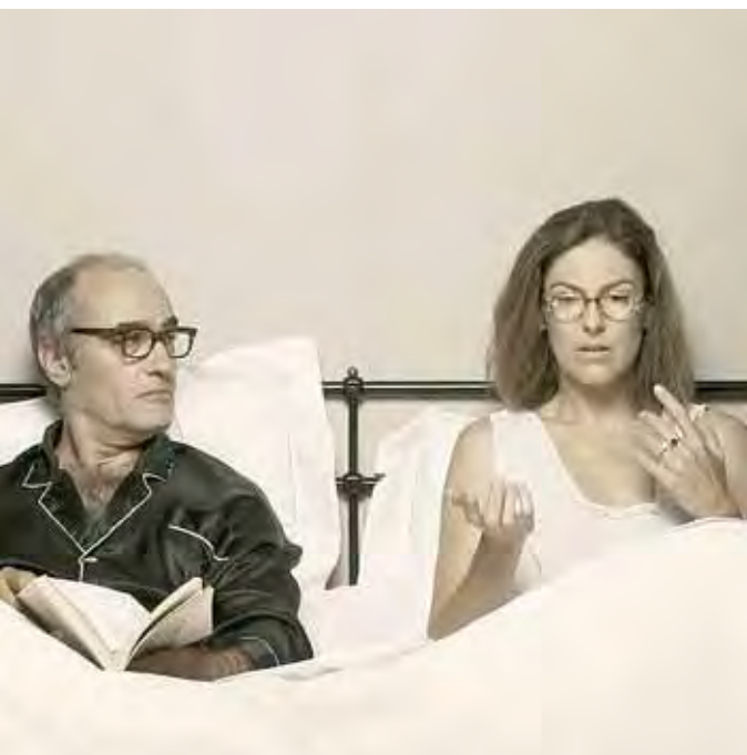
Escenes d'un matrimoni i Saraband, de Bergman.

Amb La Llotja en funcionament, deixarà de ser necessari que els lleidatans es desplacin a Barcelona o a Madrid per poder ser espectadors dels esdeveniments teatrals extraordinaris, ja que la caixa escènica tindrà una boca de 19 metres i una profunditat de 15. I la platea, un aforament per a mil espectadors.