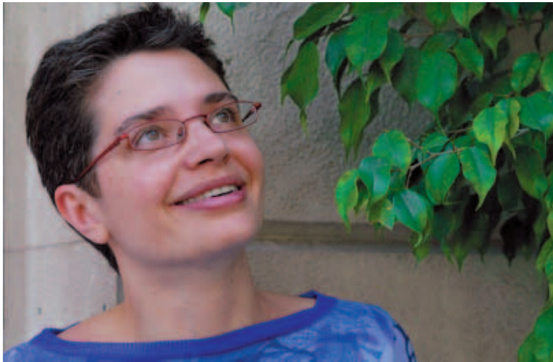
La escritora Roser Atmetlla en una imatge de archivo