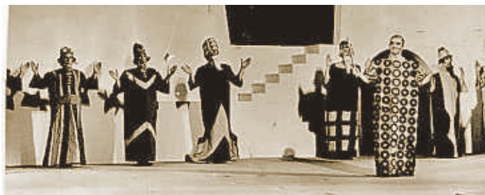
Escena de Ronda de mort a Sinera , en su versión de 1965

■ Un dia/Mirall trencat . En el 2008, Ricard Salvat montó compañía, con un elenco de lujo, para este proyecto sobre la obra de Mercè Rodoreda que estrenó en el teatro Borràs.