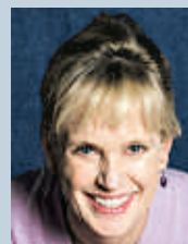
Siri Hustvedt Elegía para un americano / Elegía per un americà

Con esta cuarta novela Siri Hustvedt se adentra, creo, en la plena madurez narrativa. Alérgica a las concesiones, hoy es dueña absoluta de sus registros expresivos. Ese dominio es el que le permite, arrancando de una enigmática nota del diario del padre muerto (emigrante noruego), hurgar en las complejidades mentales y éticas del psiquiatra y psicoanalista Erik Davidsen y su hermana Inga, escritora viuda de un escritor mitificado, personajes obligados a reinventarse el pasado a la vez que enfrentan sus propios espectros y las relaciones con el mundo enfermo que los circunda. No es una obra fácil ni complaciente. Por fortuna para la literatura, las de Hustvedt nunca lo son. Exige a los demás lo mismo que a su talento creador. Por eso es de lectura obligada. R.S.