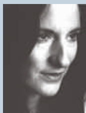
Stef Penney La ternura de los lobos / La tendresa dels llops

Las buenas novelas de aventuras árticas no murieron con Jack London. La prueba: esta estupenda narración de la debutante escocesa Stef Penney, que ha urdido una absorbente historia de tramperos y cazadores en plena tundra canadiense, con amores prohibidos de por medio. Situada en los Grandes Lagos en 1873, La ternura de los lobos recrea la implantación de una gran firma peletera en la zona y, con este fondo de codicias capitalistas describe a unos colonos que, en medio de una naturaleza salvaje, descubren la auténtica dimensión de sus instintos primarios. C.B.