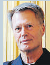
J.M.G. Le Clézio La música del hambre / La música de la fama