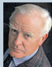
John le Carré El hombre más buscado / L'hombre més buscat

Hamburgo es el escenario escogido por el maestro del relato de suspense y espionaje John le Carré para mover los hilos de su, una vez más, perfecta y amarga intriga. En esta ciudad que albergó la más importante célula del atentado del 11-S en Nueva York, el espionaje alemán, británico y estadounidense se ponen en marcha –o en estado de delirio, y de cinismo chapucero– con el aviso de que un joven checheno ha conseguido eludir a las autoridades suecas y se encuentra en la ciudad. Le Carré radiografía en El hombre más buscado a quienes nos protegen contra el terrorismo internacional, y de momento sólo consiguen confundir a un atildado banquero, demonizar a un ángel y enredar al más noble de los seres humanos. Imprescindible. LN.