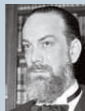
Camilo José Cela Correspondencia con el exilio