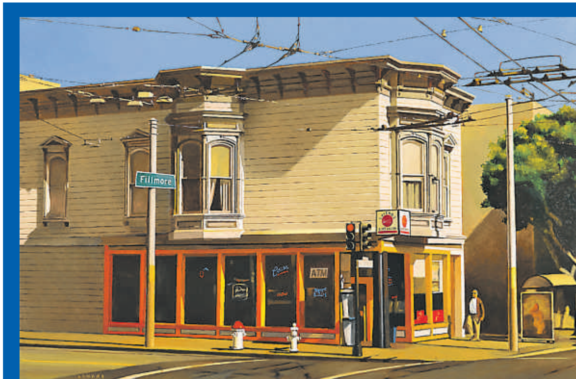
'SIEMPRE ME SIENTO ATRAÍDO POR LOS LUGARES DONDE HE VIVIDO'

El repertorio memorialístico viene variado: de Luis Racionero a Hans Küng y de Friderike Zweig a Charles Darwin. También destacan los epistolarios de Cela, Joseph Roth y Rimbaud. Y en biografías, la de Trias Fargas