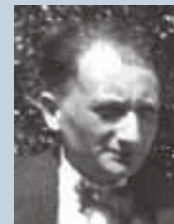
Joseph Roth Cartas (1011-1939)