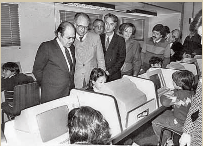
El ex president de la Generalitat de visita al mercado de Vic en 1988, a las fiestas de Gràcia en 1985 y a un aula de informática (1984)

Felipe González, Pasqual Maragall, de quien Pujol no se fiaba, Joaquín Almunia, Alfonso Guerra, Enrique Múgica, Narcís Serra o Joan Reventós, todos ellos destacados socialistas, son recordados en estas memorias que Jordi Pujol ha pergeñado. No es muy piadoso con ellos. |