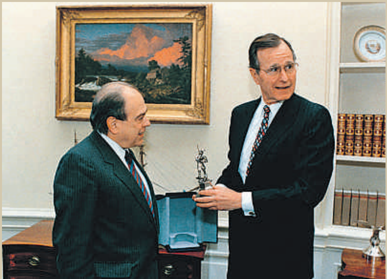
Jordi Pujol en Queralbs (agosto de 1992), junto a Leopoldo Calvo Sotelo y Adolfo Suárez en el Congreso de los Diputados (1983) y con George H.W. Bush en la Casa Blanca (1990)