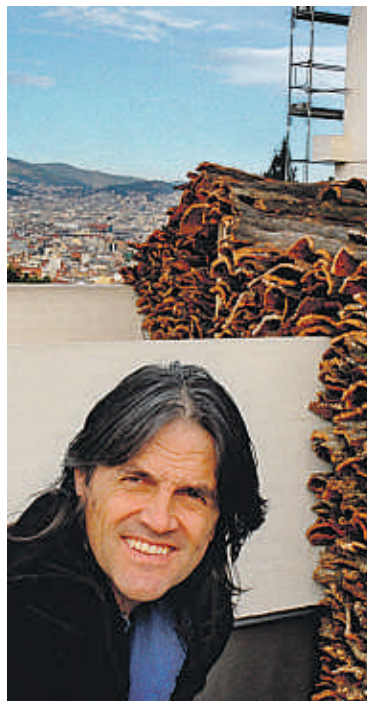
El escritor y artista Perejaume XAVIER CERVERA

Perejaume se revela aquí como testigo crítico de la ocultación de la naturaleza y de la sobresaturación de la cultura. Y no es que al prolífico y polifacético Perejaume –poeta y pintor, artista multimedia