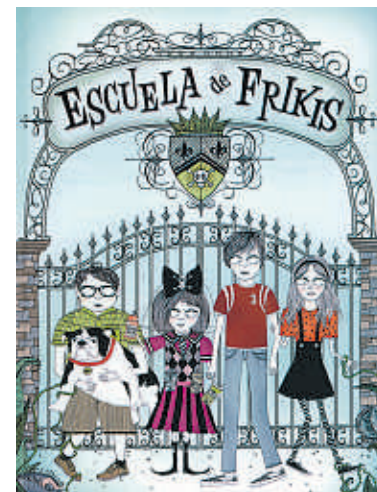
Ilustración de portada de 'Escuela de frikis', de Montena