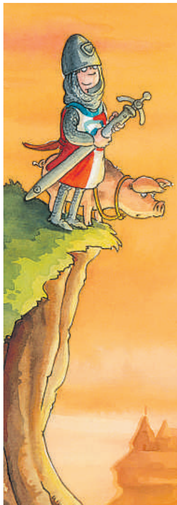
Ilustración de portada de 'Las aventuras del caballero Trenk', de Salamandra