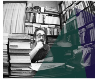
Pedrolo, l'elefant contagiós (II)