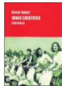
GIANNI CELATI Vidas erráticas

Las idioteces de la adolescencia son inconfundibles por lo demás (yo diría incluso que constituyen casi la esencia de la adolescencia) y cualquier persona honesta las reconocerá, a no ser que las haya perpetrado en la edad madura, en cuyo caso no tiene ya remedio y no le va a gustar este libro. Ni muchas otras cosas suculentas de la vida seguramente. Las idioteces tienen algo conmovedor y son necesarias, supongo, para crecer, porque como dice la sentencia bíblica: Ay de aquel que no haya hecho una idiotez en su vida (antecedente veterotestamentario del famoso dicho: no te fies de los célibes ni de los abstemios). Tal vez el lector se identifique con algunas, pues son muy comunes, aunque también hay que decir que estas son las idioteces propias de hace dos generaciones, idioteces históricas por lo tanto, o idioteces dialécticas si me permiten la expresión; las de la adolescencia de hoy,