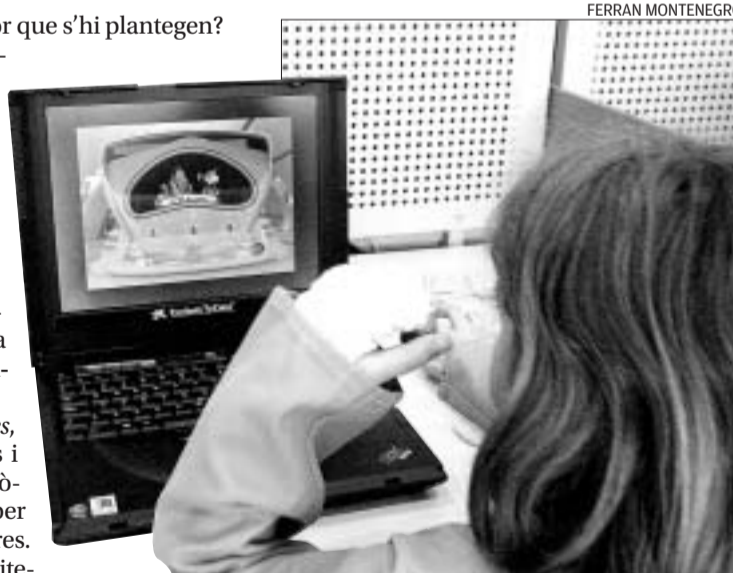
A cada franja d'edat li correspon un espai a QL.

I no es tracta de parlar de llibres a l'estil dels crítics o dels professors de literatura, sinó de fer-ho amb naturalitat i pel simple plaer de compartir i descobrir altres lectu-