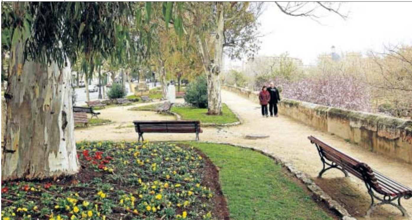
La novel·la fa un homenatge a la ciutat de València, «la ciutat que ens fem a peu». MANUEL MOLINES