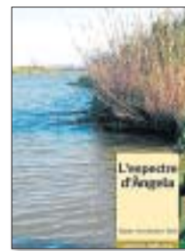
ALBERT HERNÁNDEZ I XULVI L'espectre d'Àngela ► PERIFÈRIC EDICIONS, 2011.

A banda, els resultats de les anàlisis i conclusions possibles, tant l'obra com la personalitat de les nostres excel·lents poetes i escriptores ens són, i ens seran, imprescindibles i necessàries per entendre i estimar sense condicions la cultura i la literatura de casa nostra, perquè difícilment un país que no respecta i estima la seua cultura, pot esperar que siga respectada i estimada pels altres.