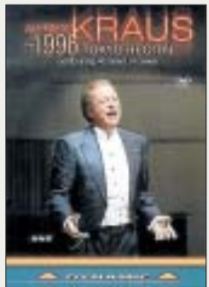
Recital en Tokio Arias, romanzas y canciones Dynamic Un DVD

En febrero de 1999 Alfredo Kraus daba su último concierto en el Palau de la Música de Valencia. El concierto dejó evidentes algunas carencias en el fiato y en la afinación por exceso de vibrato que el gran público no apreció por los interminables aplausos y los bravos jaleados con piropos. Pero algo aciago flotaba en aquel postrer concierto del divo grancañario. Pocos meses más tarde fallecería víctima de un cáncer. Viene a cuento esta referencia, porque en el vídeo que vamos a comentar, grabado en 1996 en un recital en Tokio, el tenor junto con los mismos acompañantes y vistiendo el mismo frac y una camisa cuello Mao de seda, ofreció un programa idéntico en muchas mejores condiciones. Para los sentimentales adoradores de Kraus, entre los que se cuenta quien esto escribe, este vídeo constituye toda una revelación documental, muy emotiva, para recordar aquel concierto valenciano. En el recital de la capital de Japón está, casi incólume, la elegancia en el fraseo, la dicción esmeradísima, y la acomodada adecuación a repertorios distintos que van desde la ópera barroca (apuntada con aristocrático relato) a la canción española (emotiva en su aliento paisano) y a las grandes referencias de ópera y zarzuela en las que volcaba aquel ardiente ímpetu que siempre caracterizó su canto, referido con una paradigmática elegancia, con una admirable técnica y una emisión diáfana, ecuánime y eminente de vocalización. Un testimonio impagable.