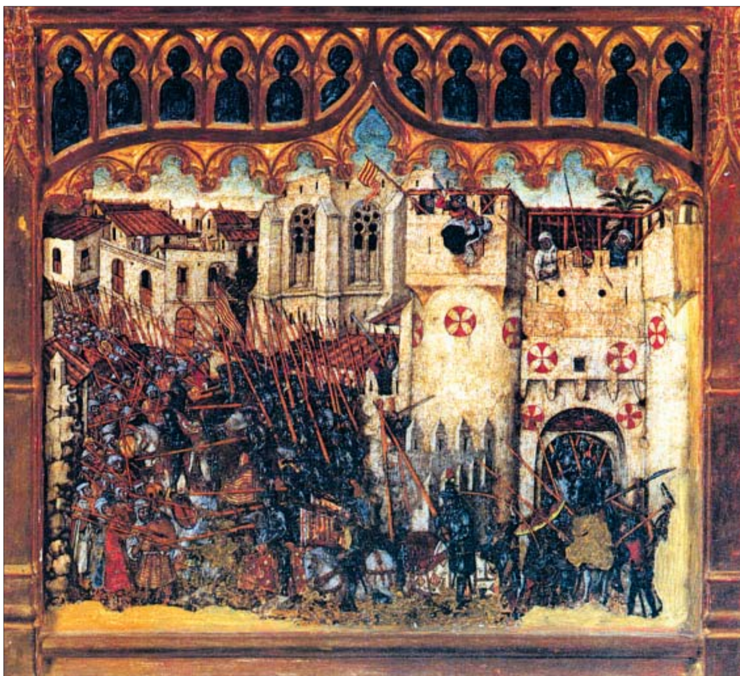
JOAN RAMON BONET

Frente a visiones idealizadas de la conquista de las tierras de la corona de Aragón, nuestro musulmán alcireño afirma en el prólogo de su crónica: «Esta es la relación de los hechos de Mallorca y su toma por los "rum" (romanos, cristianos), desde el momento en que los "rum" iniciaron la empresa con el deseo de capturarla hasta que destruyeron su realidad. Se apoderaron de la tie-