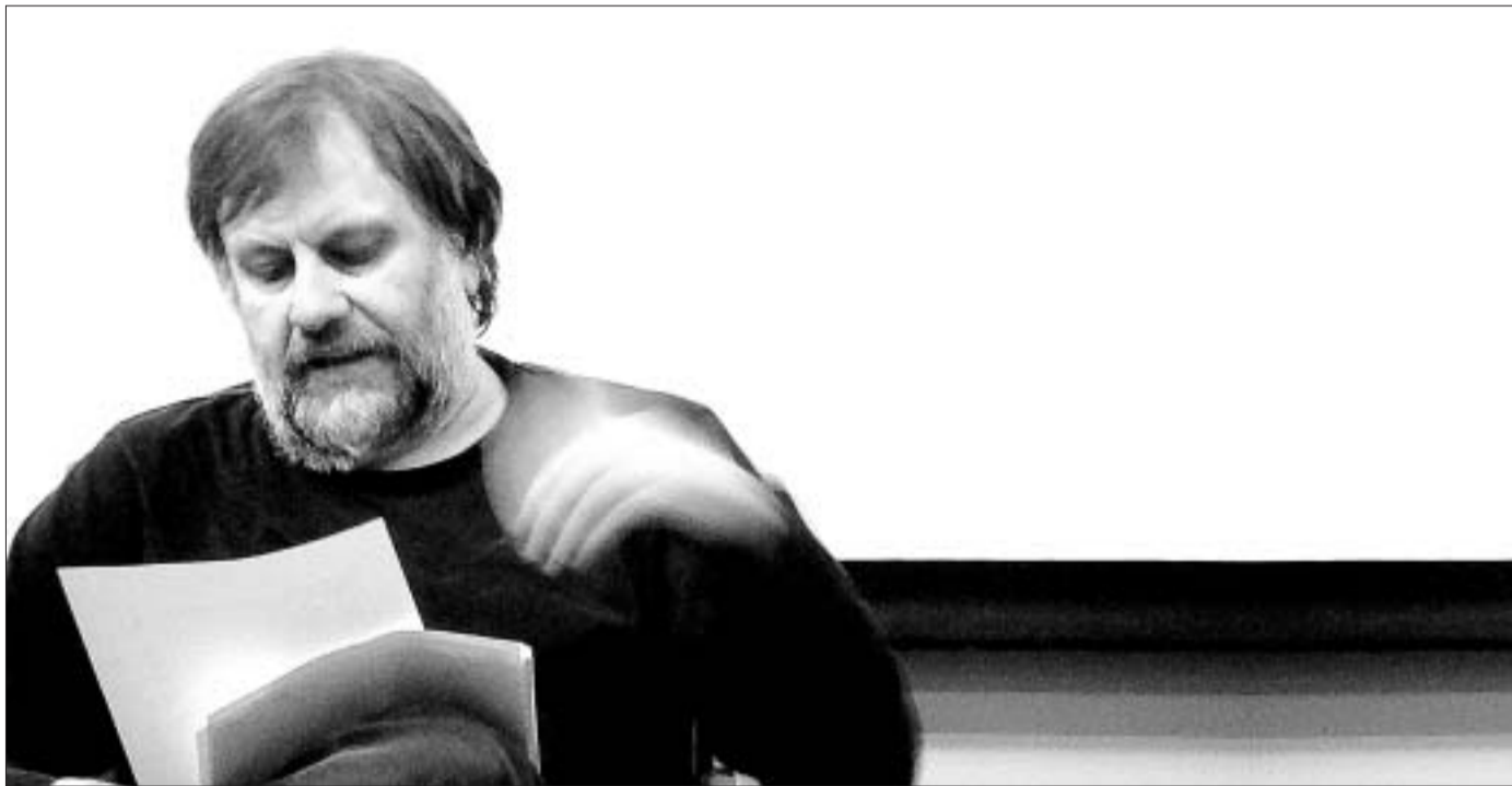
Slavoj Žižek (Liubliana, Eslovènia, 1949) és considerat un postmarxista.

★★★★★ EXCELENTE ★★★★★ BUENO ★★★ ACCEPTABLE ★★ REGULAR ★ MALO