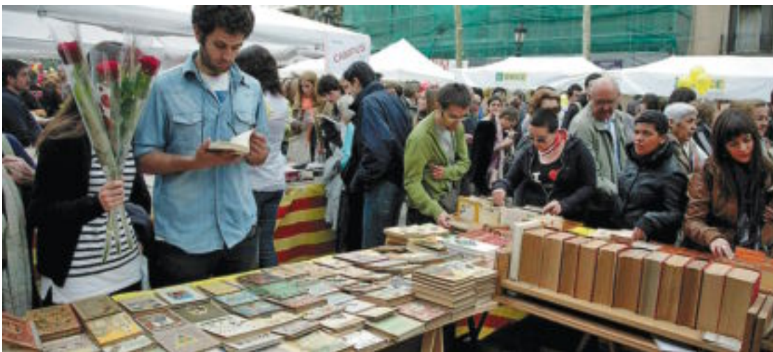
Festa de Sant Jordi a la Rambla de Barcelona.

ner. Quant al primer, el nom de Puntí ja és una garantia, perquè tot el que ha publicat fins ara és valuós. D'altra banda, el prejudici contra la novel·la de gènere ha fet que, a Torrent, se'l consideri un autor d'èxit, però menor, i que es passe per alt la destresa amb què ordeix les seues trames i l'eficàcia punyent del seu humor. Amb alguna excepció (un crític tan dur com Ponç Puigdevall ho va saber veure, això), Torrent és un narrador molt més intel·ligent que els seus comentaristes. Com a columnista, Empar Moliner sol cultivar la picardia i la insolència, però això no impedeix, tampoc, que siga una narradora hàbil i incisiva. En resum, que el panorama no està gens malament. Més encara, si afegim dos