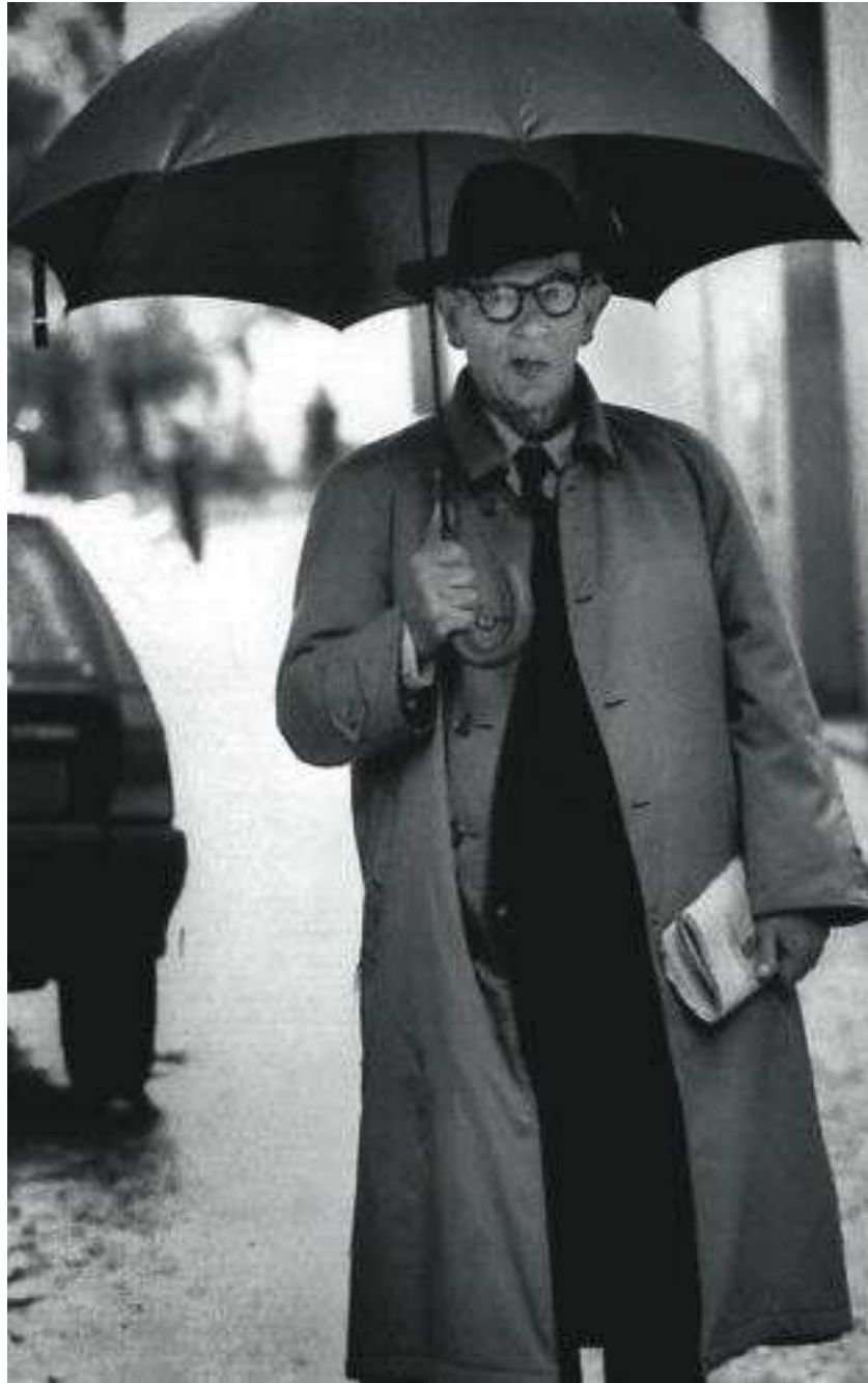
Isaiah Berlin, professor d'Oxford i assessor del Foreign Office, va desenvolupar una obra erudita i força astuta.

història de les idees, el bo i millor dels assaigs de Berlin té més a veure amb les humanitats, la filosofia i encara la ideologia que amb la recerca d'objectivitat dels estudis històrics. A pesar de ser un se-