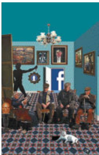
Coberta del llibre.

Per orientar el lector, podríem parlar de postliteratura de l'era Internet. O, menys ampullós, un llibre en els llindars de la literatura. “Estar en els marges és el que m'inter-