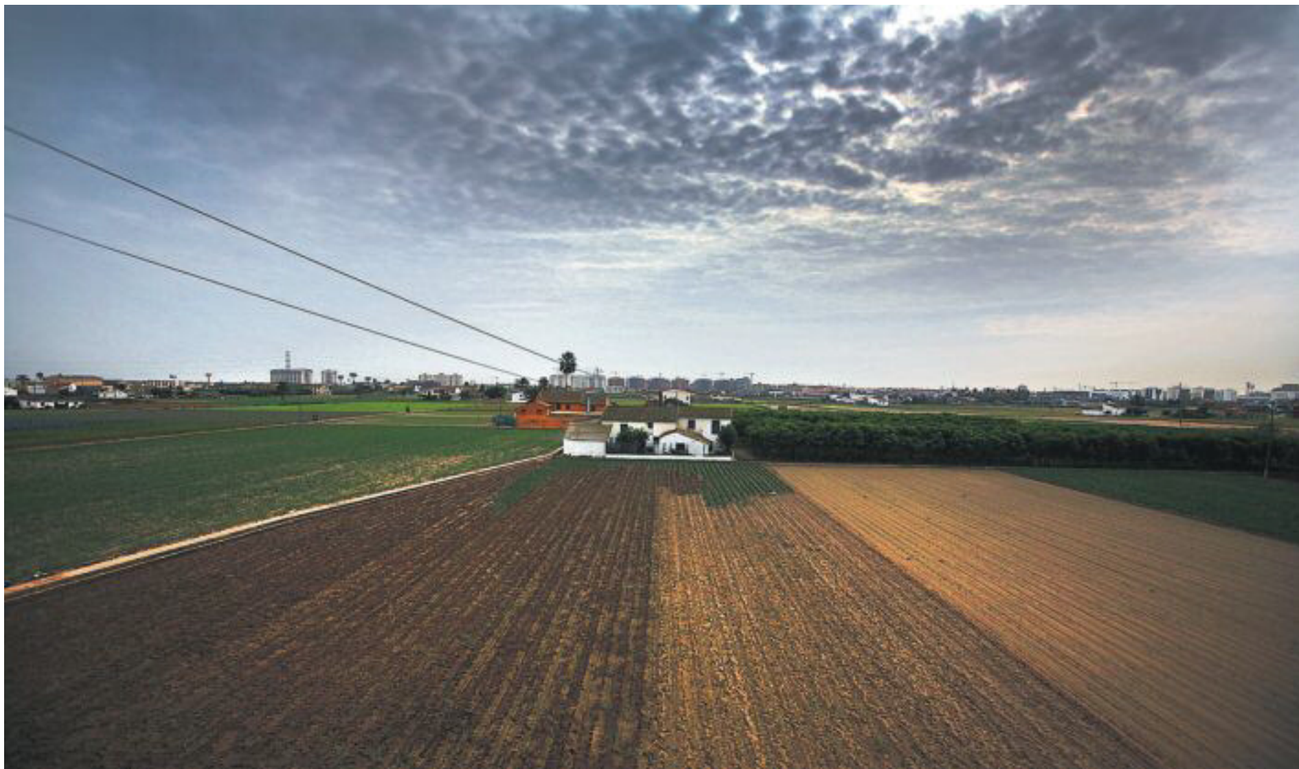
El mil·lenari sistema de l'Horta de València i la relació entre territori i societat són objecte d'atenció dels instituts d'estudis comarcals.