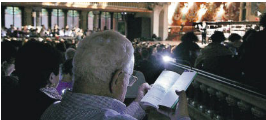
Festival Internacional de Poesia al Palau de la Música de Barcelona.

Tot això està molt bé, sense dubte. Però que vulga saber que és Barcelona Poesia, ara com cada any, haurà fet bé d'acostar-se a algun dels espectacles menys publicitats que omplien aquests dies la ciutat, als bars moderns, en algunes llibreries, en certes places. Allà on podia sentir, en directe, el triomf indiscutit de la polipoesia. I què és això de la polipoesia? Jo no seré tan atrevit de definir-la. Pot ser un xicot d'aspecte relativament sensat que enarbora un metrònom i, al seu compàs, mussita molt baixet "l'estime" a un auditori embriac; pot ser una joveneta d'aire virginal, tota rínxols i pigues, que reballa procacitats al respectable com si fóra la cosa més natural del món; potser una colla d'atletes que salta i balla mentre una pantalla projec-