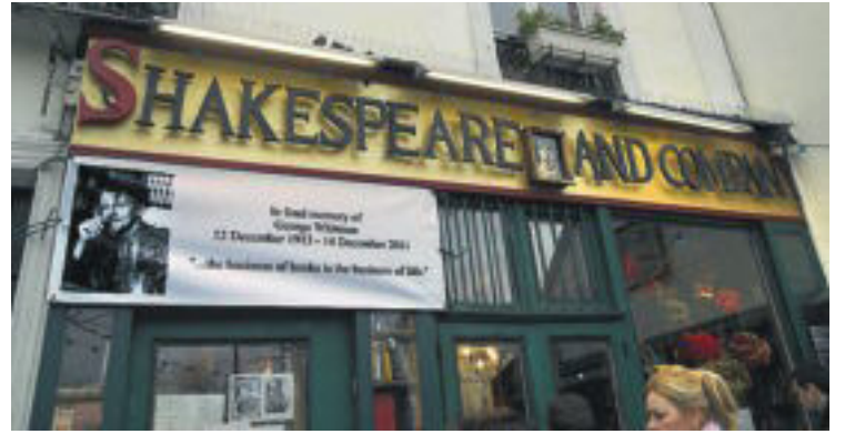
La llibreria Shakespeare and Company, a París.