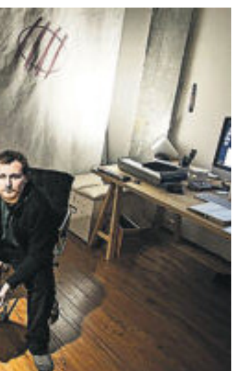
Dues imatges del fotògraf Xepo W. S. a Xangai.

I per si cap lector subratlla les aventures eròtiques que travessen el text amb una certa insistència, propose tenir en compte la distinció entre les que se'n van per vies viscontinianes, més etèries i deliquescents, i les que tenen un aire estellesià realment envejable. És a dir, em quede amb la cosina del capítol 13, d'una família puritana i laica amb ideals republicans, que culejava dins una faldilla de tub a la manera de Hollywood. Al capdavall, no cal ser dissenyador gràfic per a entendre Max Ernst quan afirmava que "s'aprén més de la nuesa d'una dona que de les lliçons d'un filòsof".