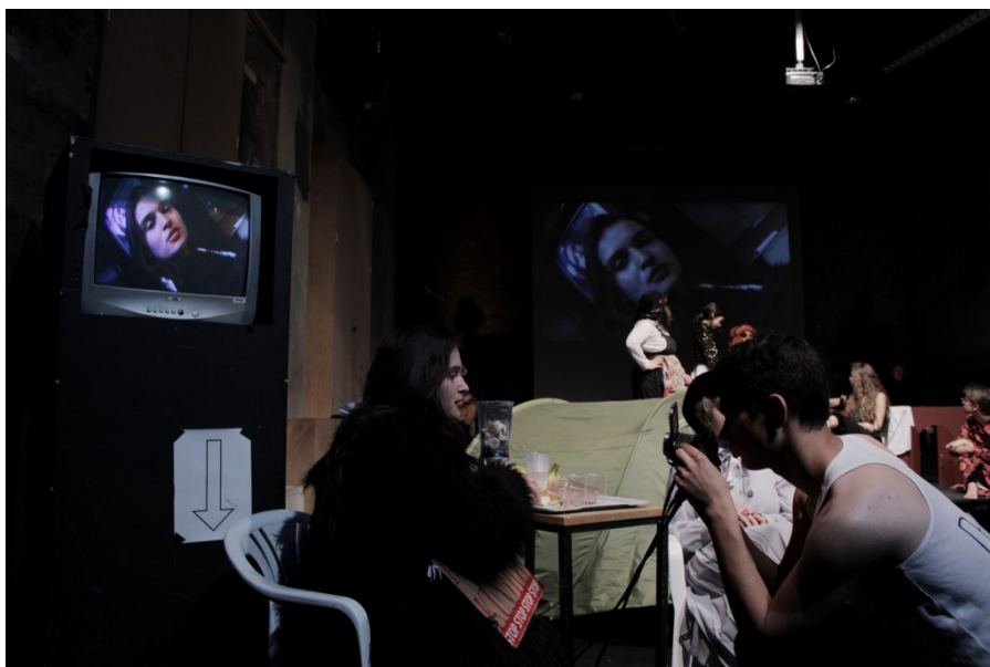
Leonce und Lena. Dritte Stock, Volksbühne, 2015.

El grup jove de la Volksbühne OST, el P14, es va fundar l'any 1993. Des del 2008 nosaltres som membres d'aquest grup i hem pogut realitzar diversos projectes de creació. Aquí, a l'escenari del tercer pis del teatre de la plaça Rosa-Luxemburg, hem tingut l'oportunitat d'equivocar-nos fent allò que ens venia de gust. Per tant, es podria dir que nosaltres som seguidors de la Volksbühne, una mica com si fos el nostre equip de futbol preferit. Des del 1992, aquest teatre ha seguit el rumb del director d'escena Frank Castorf. Les seves obres se solen conèixer per la seva llarga durada i estridència. La que havia de ser la seva última peça era una versió del Faust de Goethe que se centrava en el tema del colonialisme en relació amb la lògica capitalista. Durava set hores. Inesperadament, Castorf va anunciar que realitzaria una darrera obra el juny de 2017: Ein Schwaches Herz ( Un cor dèbil ), basada en la novel·la homònima de Dostoievski. El resultat d'aquesta suposada «petita producció» fa palès l'esperit de Castorf i els seus companys artistes de la Volksbühne: vuit actrius i actors, afegint text de Mikhaïl Bulgàkov, i tres hores i quaranta minuts de durada.