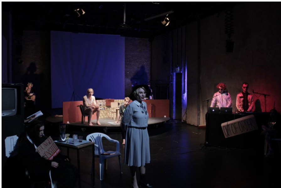
Leonce und Lena . Dritte Stock, Volksbühne, 2015.

La causa de la pedagogia teatral es tradueix en iniciatives que tenen l'objectiu de fer que les grans institucions i l'alta cultura siguin més accessibles per a la ciutadania. Tanmateix, a la pràctica, el funcionament de cadascuna d'aquestes iniciatives varia en cada cas. El P14, per exemple, funciona de forma diferent que els seus equivalents: el Gorki X del Maxim Gorki Theater o el Junges DT del Deutsches Theater. Normalment, aquests grups encarreguen a una o a un professional del teatre que acompanyi els joves en el desenvolupament d'una peça teatral. Al P14, en canvi, els joves gaudeixen d'una autonomia gairebé absoluta. L'eslògan del grup és: Macht euer Theater selber! En català: Feu el vostre teatre vosaltres mateixos!