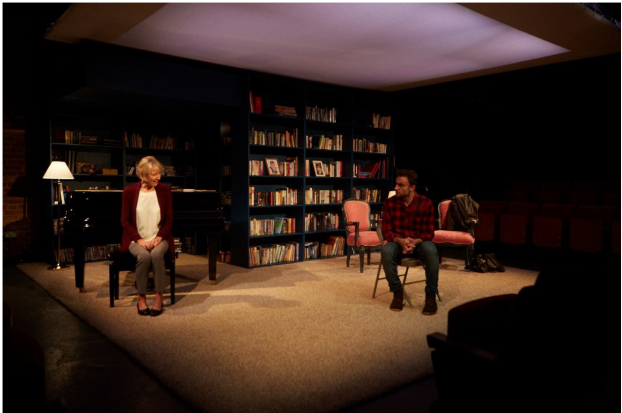
The swallow (L'oreneta) (Cervantes Theatre, London, 2018).

En gran part tot plegat explica per què me n'hi vaig anar a viure el 2014 i per què és més fàcil per a mi estrenar una obra a Londres, Atenes, Bucarest o Nova York abans que a la meua ciutat i en la meua llengua materna. Ha passat amb Gust de cendra , La terra promesa , L'oreneta i probablement tornarà a passar amb Al damunt dels nostres cants , últim Premi de Teatre Ciutat d'Alcoi, que ja s'està traduint a l'italià..