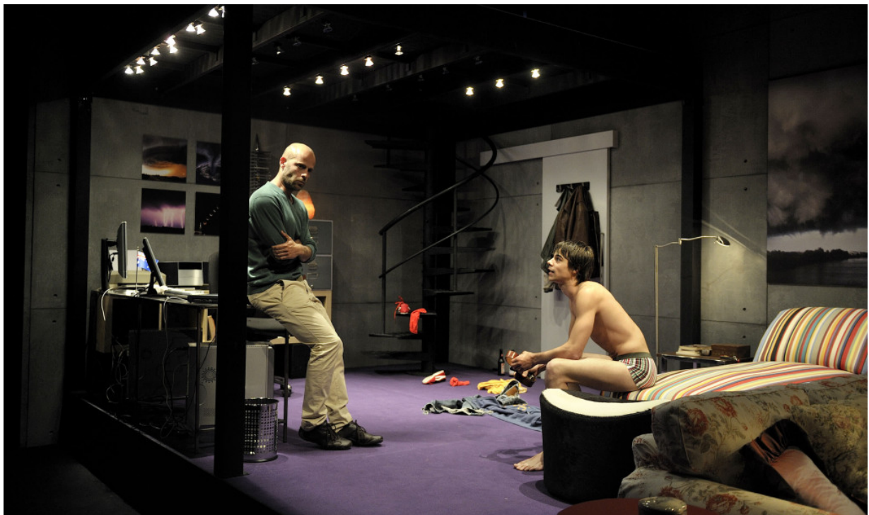
Marburg (Teatre Nacional de Catalunya, 2010).

I.F. Marburg sembla insinuar que tots, d'una manera o d'una altra, estem malalts, perquè és el món, al cap i a la fi, el que està malalt. Tu mateix ho dius en el pròleg: «la malaltia [...] forma part inherent de la nostra existència». Alguns pensadors, com Paul B. Preciado, critiquen que la salut no és un dret, sinó un altre negoci en les societats neoliberals, i també una manera de decidir, mitjançant el preu dels tractaments, qui viu i qui mor. Què significa per a tu, la idea de malaltia, d'epidèmia, a Marburg ?