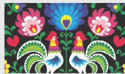
Mònica Ballet A "L'avantçat"