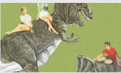
Vicenç Pagès A "L'avantçat"