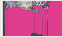
Uxue Apaolaza A "L'avançat"