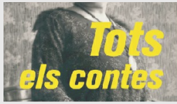
Victor Català A "L'avançat"