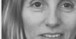
Mònica Batet A "El traduït"