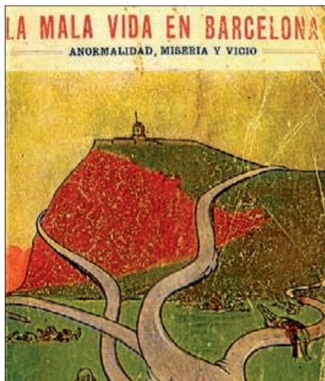
▶▶ Portada d'un llibre de la col·lecció 'Los bajos fondos de Barcelona'.

Perquè fa 80 anys, igual que avui, els carteristes multireincidents ja feien estralls a les concorregudes zones turístiques. Això sí, en lloc d'aprofitar-se de les aglomeracions del metro, actuaven als tramvies. «Jo crec que el carterista és un personatge marcadament barceloní», va arribar a escriure Bellmunt, que feia mofa de la inquietud que les autoritats mostraven davant la mala fama internacional que, exactament igual que avui, aquests pispes donaven a la ciutat. «El carterista barceloní ha contribuït a donar relleu internacional a la nostra