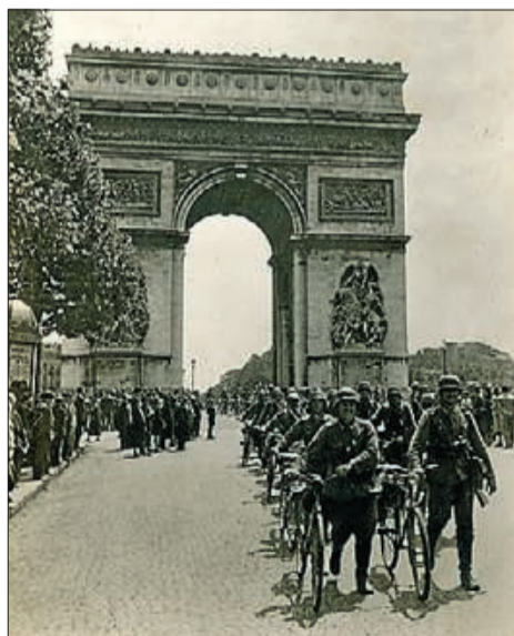
▶▶ Els nazis, entrant a París.

El volum ara recuperat és en molts aspectes una obra bessona (i en molts altres, superior) de La extraña derrota , llibre pòstum de l'historiador francès Marc Bloch, cofundador dels Annales i executat el 1944 com a membre de la resistència. I això no és poc. Bloch relata la seva experiència com a professor mobilitzat per exercir com a capità d'Estat Major al Primer Exèrcit, fugint de l'avanç alemany. Chaves Nogales treballava en les emissions de la ràdio francesa per a Espanya i Amèrica Llatina i amb ella es va replegar a Tours i Bordeus. Tots dos transcen-