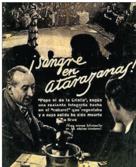
▶▶ Portada d'«El Escándalo».

Sang a les Drassanes (que es publica ara en català) va recollir el 1926 els seus articles sobre els baixos fons al setmanari El Escándalo . Madrid és un moralista que escriu dels «invertits» que exhibeixen pel carrer «les seves vergonyes, el seu impudor i el seu pecat». També una bona persona que detesta els «imbècils presumits» que se'n riuen de la bogeria de la Monyos. I un periodista modern que