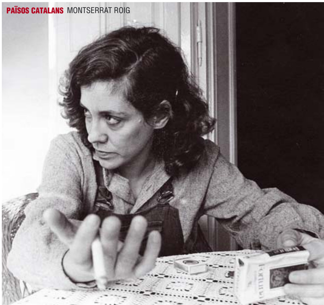
Montserrat Roig, en una entrevista de 1981.

tres no la tindriem mai en la seva totalitat. Però hi ha silencis que són més feixucs que d'altres [...] Hi ha aspectes del nostre passat recent que semblen haver estat engolits per l'absurd, pel no-res. Aquest és el cas dels catalans antifeixistes que patiren la deportació als camps nazis.»