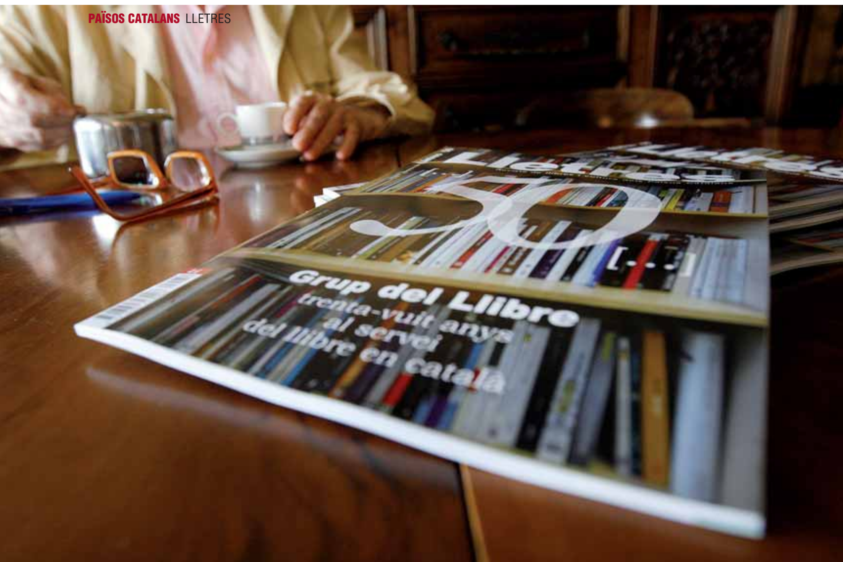
Imatge de la portada del número 50 de la revista Lletres . / ALBERT ALEMANY