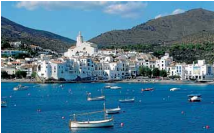
A Cadaqués encara es parla salat. / ROBERT CARMONA.