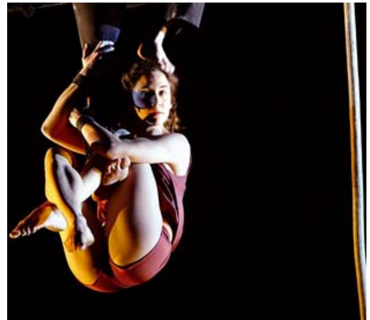
A l'esquerra, Suz o Suz (1986), el primer títol de la Fura dels Baus al Mercat. A dalt, Alè (1986), de Comediants. Sobre aquestes ratlles, 1980 (1986), de Pina Bausch, i una actuació de Cia. Kabam a la Marató de l'Espectacle (2004).