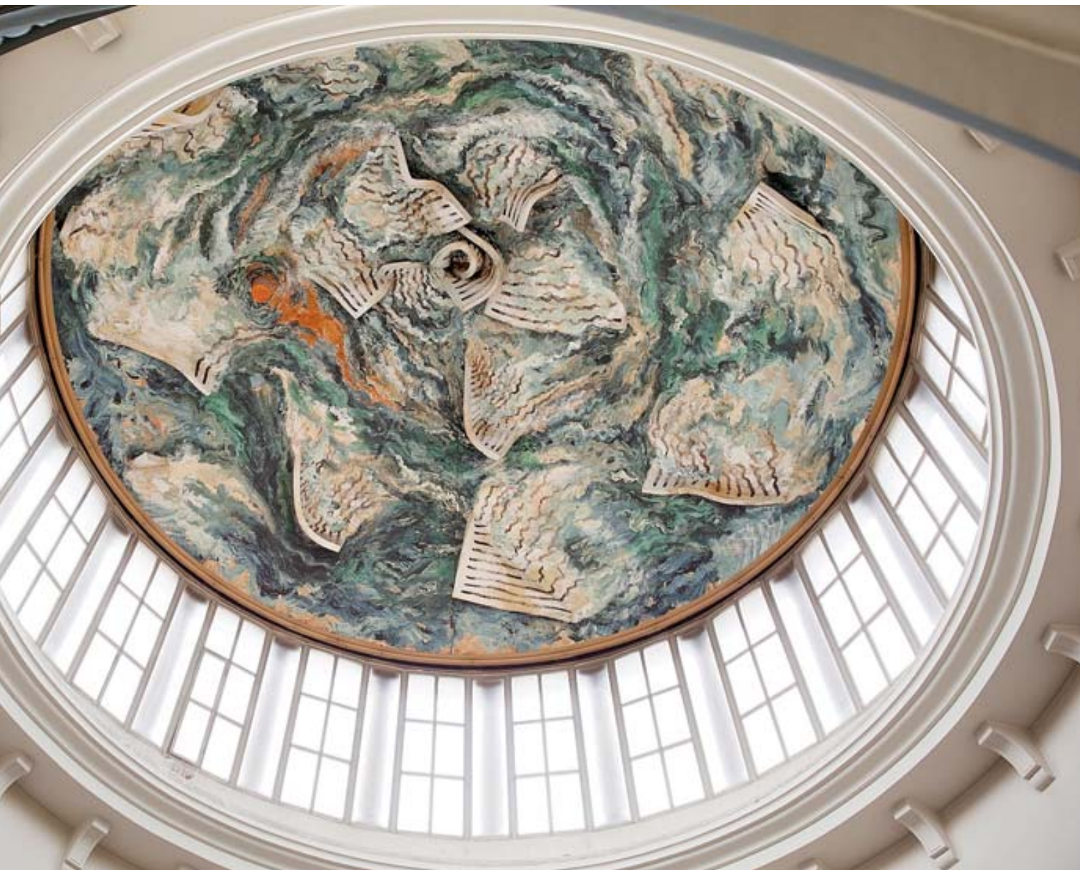
La cúpula que Miquel Barceló va construir per al Mercat de les Flors, a meitats dels anys vuitanta. La va muntar a la sala Maria Aurèlia Campmany i, posteriorment, la van fixar al sostre.