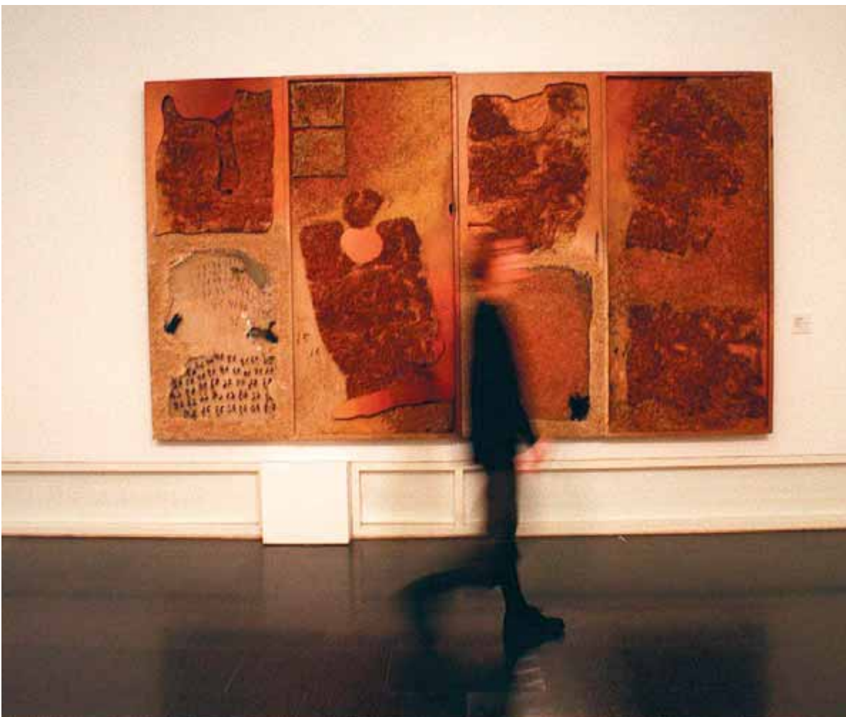
Sala dedicada a Dau al Set de la col·lecció permanent del MACBA.

nous artistes poden sortir de Barcelona, sobretot per anar a París. Tàpies guanya el premi i decideixen, amb Cuixart, partir-se'l. Junts van a París. A partir d'aquest viatge –cadascú n'explica la seva versió–, els cosins entren en una dinàmica d'enfrontaments que els porta a la tomba sense cap reconciliació.