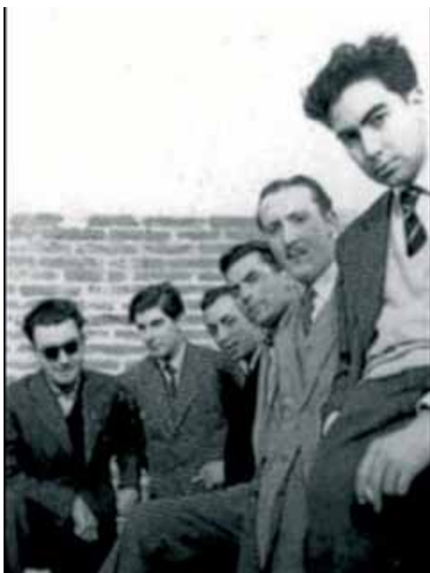
Els sis components de Dau al Set.

Juan Eduardo Cirlot, poeta i músic, es converteix en el setè component del grup. Li interessa l'alquímia, la càbala, les civilitzacions antigues, el món medieval i la música dodecafònica. Qüestions que fascinen els altres components.