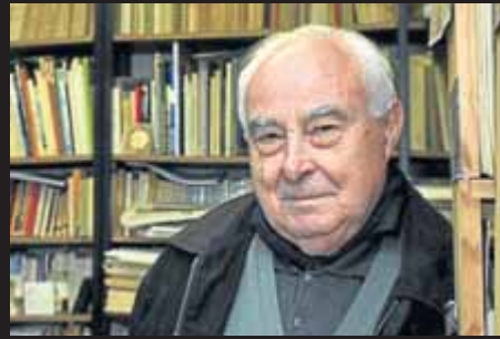
Arnau Puig. (Barcelona, 1926), filòsof, crític i sociòleg de l'art català. Un dels principals impulsors de l'avantguardisme a Catalunya.