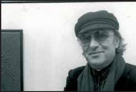
Joan Ponç. (Barcelona, 1927 - Sant Pau de Vença, 1984), pintor d'un imaginari d'introspecció. Artista misteriós i esotèric.