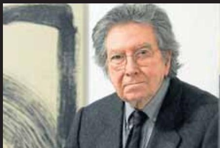
Antoni Tàpies. (Barcelona, 1923 - 2012), pintor i escultor. Un dels principals exponents a escala mundial de l'informalisme.