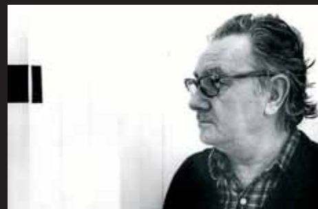
Joan Brossa. (Barcelona, 1919-1998), el poeta avantgardista català més important de la segona meitat del segle XX.