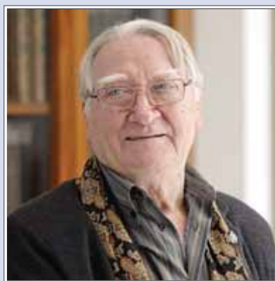
El poeta Màrius Sampere ANDREU PUIG