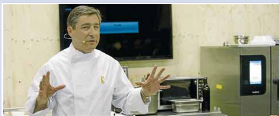
Joan Roca, xef d'El Celler de Can Roca, ha publicat el seu tercer llibre de cuina

● El considerat actualment com el millor cuiner del món ofereix una obra fonamental i sense precedents que ens descobreix les tècniques bàsiques de cuina. De manera visual, fàcil i didàctica, el xef detalla pas a pas els seus coneixements culinaris adquirits al llarg de més de 25 anys de professió per aplicar-los fàcilment a casa. Un manual únic i inèdit que conté, a més a més, una selecció de vuitanta receptes per posar en pràctica tots els secrets de la seva cuina.