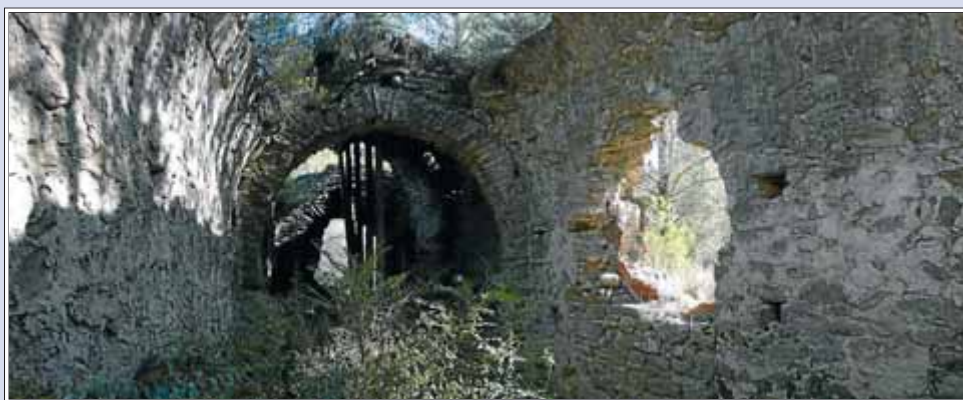
Les restes de l'església de Sidillà, el poble perdut que dona nom a l'editorial