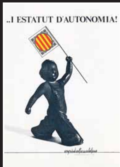
Campanya institucions autonòmiques Promoció de la campanya