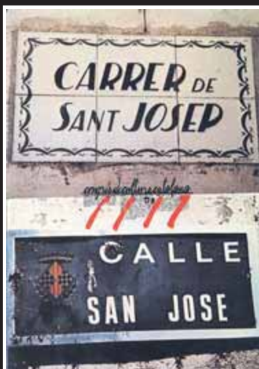
Carrers en català Cartell de la campanya 'Identificació del territori'