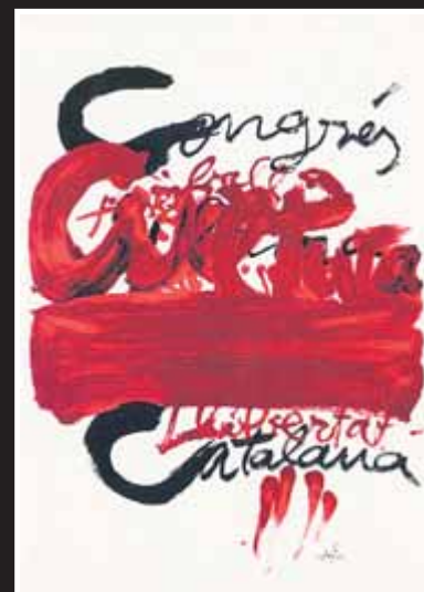
Cartell general del Congrés Obra de l'artista Antoni Tàpies