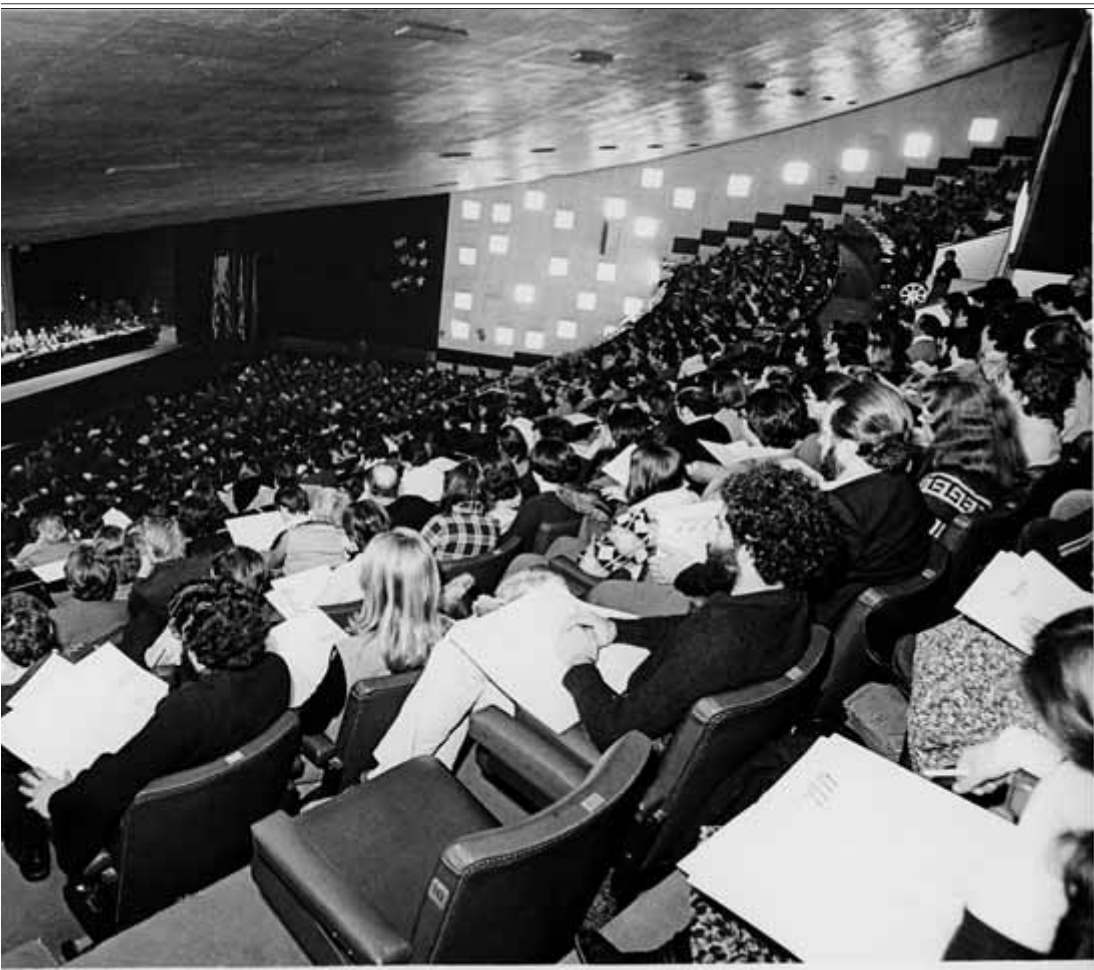
A l'esquerra, Josep Tarradellas durant un dels actes de cloenda; a la dreta, un acte de presentació al Palau de Congressos de Montjuïc. FUNDACIÓ CONGRÉS DE CULTURA CATALANA

Els organitzadors va superar ben aviat el plantejament resistencialista i van dedicar-se a traçar un full de ruta molt ampli. Només cal resseguir els vint-i-tres àmbits en què es va distribuir el Congrés per adonar-se que els organitzadors partien d'un concepte ampli de cultura, que no només abastava les humanitats ampliades, sinó