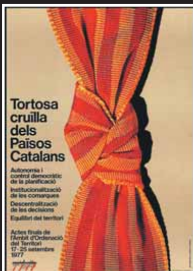
Tortosa cruïlla dels PPCC Cloenda de l'àmbit d'ordenació del territori