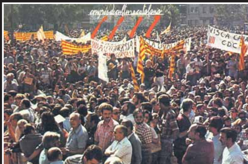
Postal manifestació Imatge de la manifestació de la Diada Nacional a la ciutat de Sant Boi de Llobregat