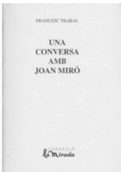
Portada de la conversa entre Trabal i Miró (La Publicitat, 14-7-1928), reeditada el 1992 per l'actual Fundació La Mirada, de Sabadell

Un dels apartats més absolutament enfollits del diari era el que dedicaven als Objectes perduts , tot indicant als interessats què podien trobar a la "Quefatura" (sic) de policia, en els quals es notifica, per exemple, que "a disposició de qui s'hi consideri amb dret, hi ha un carretó i un pràctic", o uns dies després posen "a disposició de qui l'hagi perdut, un be", i al cap d'uns dies "un porta-monedes i un altre be" (es veu que els xais fugien dels pastors...!), també "una burra i un gos caçador", "una canal de llauna", o "un colom misatger", que no deixa de ser curiós que es perdi. De fet, Trabal escriurà anys més tard la novel·la L'home que es va perdre (1929) en