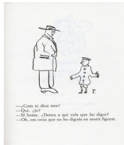
De cara a la paret (1925)