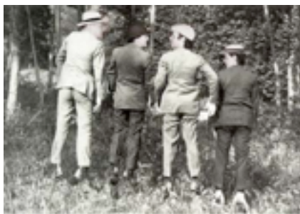
Facècia per presentar De cara a la paret (1925)

impossibilitar alguna collita. Però cal tornar-hi, negar-nos a ser mells, no oblidar qui som i reconstruir-nos. És per això, com deia, que, de tant en tant, hi ha algú que ho intenta creant una associació, fundant un grup, editant una revista... Com van fer aquells a qui abans m'he referit; com hi ha qui fa ara.