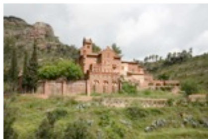
El Marquet de les Roques, a Sant Llorenç del Munt, on el 1925 es fundaren les Edicions La Mirada

En la mateixa línia, la secció de Successos és plena de curiositats, com la que diu que "Ahir s'encallà un carro al carrer Blasco de Garay, quedant una roda al lloc de l'altra", o la de l'anomenat Món anecdòtic , en què s'expliquen històries d'arbres de la ciutat que parlen, o s'ofereixen consells per tractar els ulls de poll... a la barba i al cervell! Així, també, Trabal es lliurava a intercalar anuncis, su-