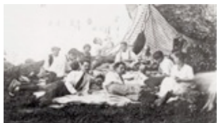
Acampada a la font del Saüc

A partir de 1918, El "Coro" de Santa Rita es reuneix sota l'aixopluc de l'Acadèmia de Belles Arts de Sabadell, institució benpensant que havien fundat alguns dels seus pares, i allí desenvolupen una part de les activitats que els faran populars - o més aviat "impopu-