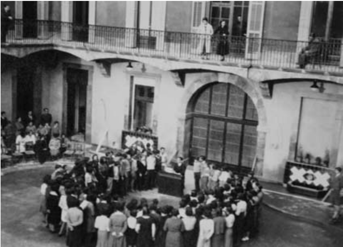
El pati de l'Institut-Escola.

Així vostè està d'acord amb els qui diuen que la LOGSE no era una llei adaptada a la realitat?